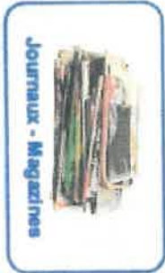
Journaux - Magazines