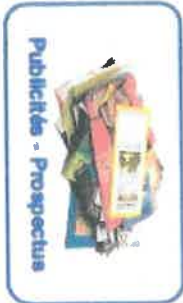
Publicités - Prospectus

M E T T R E A P L A T L E S C A R T O N N E T T E S