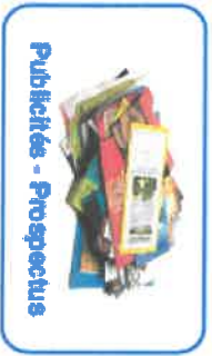
Publicités - Prospectus