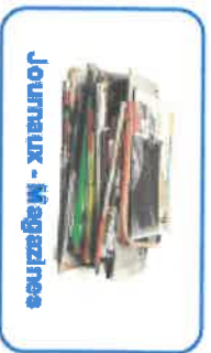
Journaux - Magazines

Situées sur le parking de l'Espace Eaux Vives ou à l'entrée du camping de laône