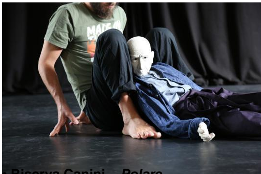
Riserva Canini – Polare

Avec sa prochaine création L'Ombre du roi, L'Ateuchus poursuit son travail d'une écriture en marionnette en jouant de ses liens avec celle de la danse. Cette création nécessitant un espace scénique permettant le travail chorégraphique, les temps de résidences entre les murs de La BatYsse s'axeront principalement sur la construction de la marionnette et des dispositifs scéniques (machine sonore, scénographie). D'autres temps de résidence et de rencontre autour de ce projet auront lieu hors-les murs de La BatYsse dans des structures partenaires du territoire (Le TEC, le Centre culturel de La Buire).